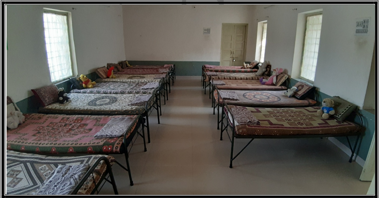
(15 થી 18 વર્ષ)