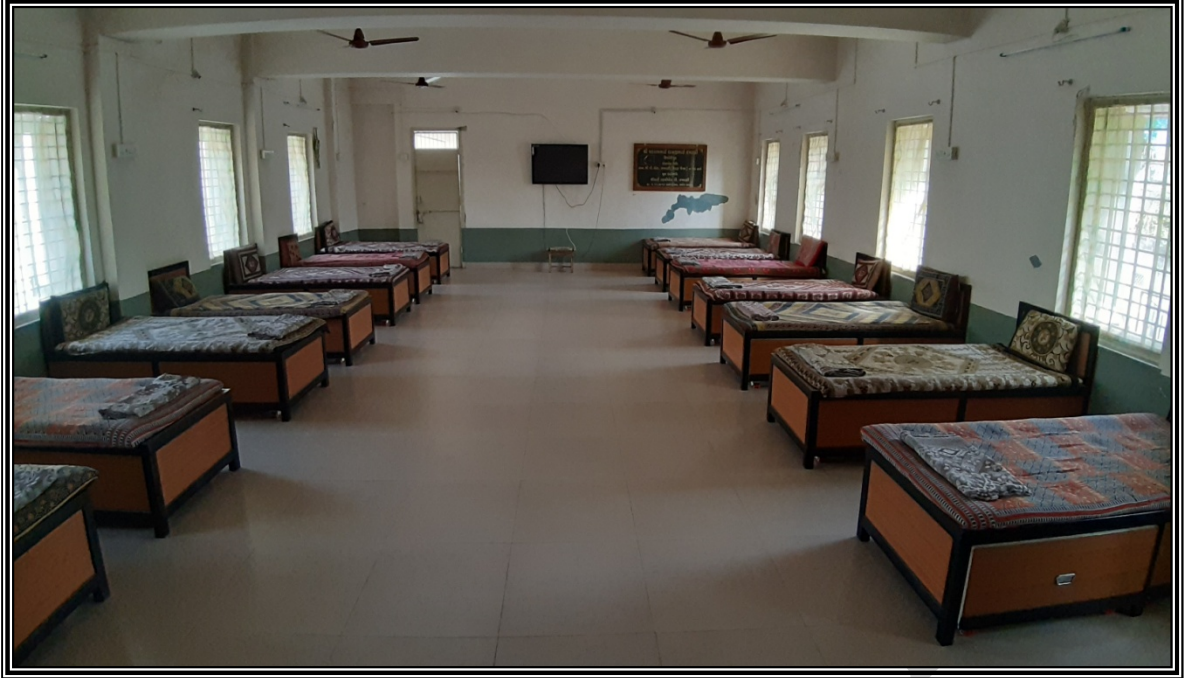
शिशुगृह (० थी ६ वर्ष)