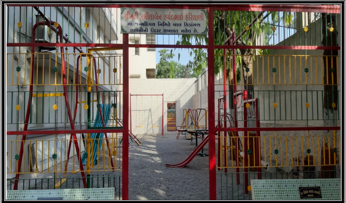
પ્રવૃત્તિ કરતી બહેનો