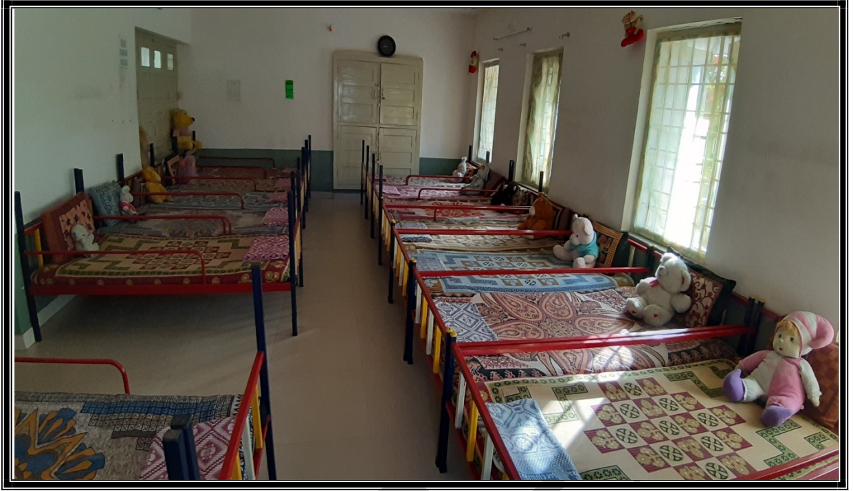
(11 થી 14 વર્ષ)