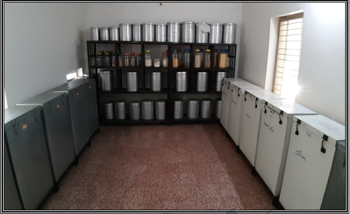
ફાયર સેફ્ટી & ફર્સ્ટ એડ બોક્સ