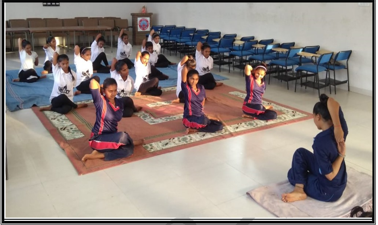
બાળકોને રેસ્ટોરન્ટમાં જમવા લઇ જતા